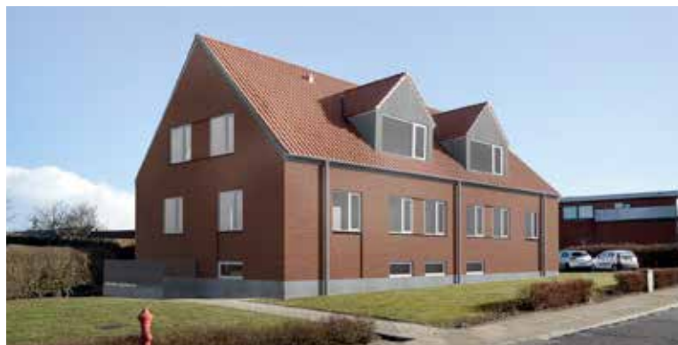
Husene på Uldalsvej får ny muret skalmur.